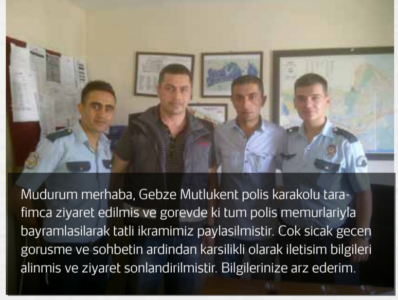
Mudurum merhaba, Gebze Mutlukent polis karakolu tarafınca ziyaret edilmiş ve görevde ki tüm polis memurlarıyla bayramlasılarak tatli ikramımız paylaşılmıştır. Çok sıcak geçen görüşme ve sohbetin ardından karşılıklı olarak iletişim bilgileri alınmış ve ziyaret sonlandırılmıştır. Bilgilerinize arz ederim.