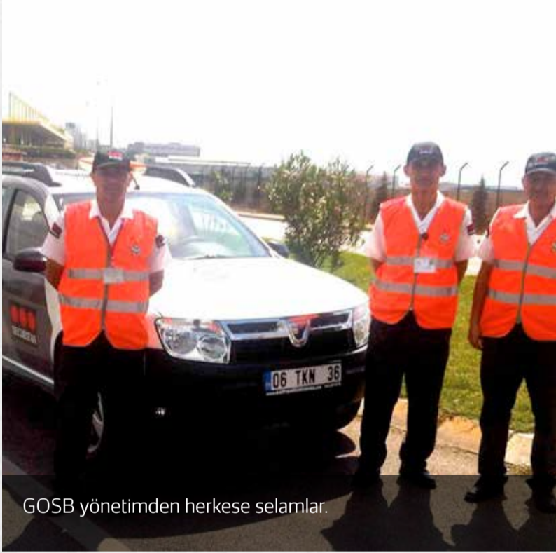
GOSB yönetimden herkese selamlar.