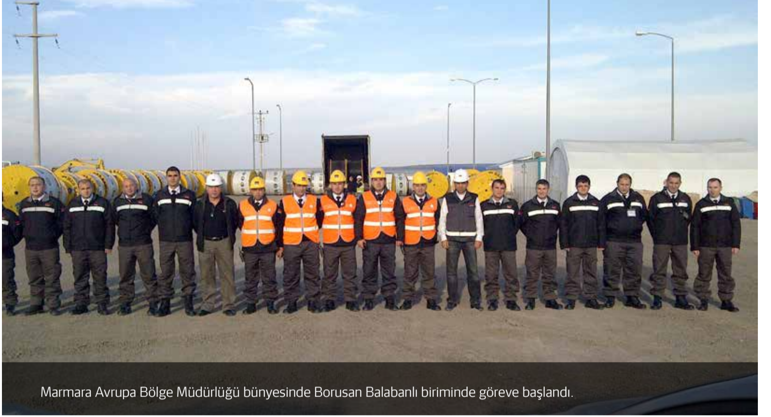
Marmara Avrupa Bölge Müdürlüğü bünyesinde Borusan Balabanlı biriminde göreve başlandı.

Securitas Türkiye, yine birçok farklı sektörde hizmet vermeye devam ediyor. Yeni projelerimizde göreve başlayan tüm çalışanlarımıza Securitas Ailesi'ne "Hoş Geldiniz" diyor ve başarılar diliyoruz.