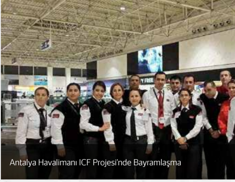
Antalya Havalimanı ICF Projesi'nde Bayramlaşma