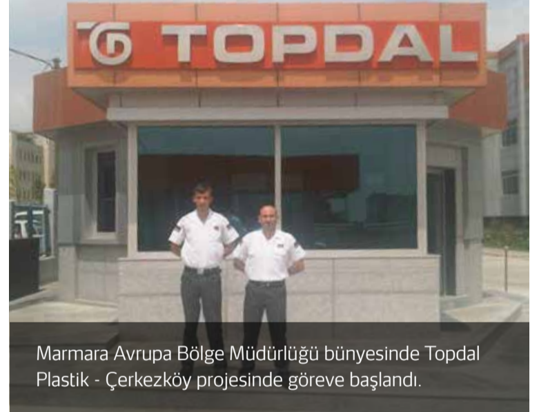
Marmara Avrupa Bölge Müdürlüğü bünyesinde Topdal Plastik - Çerkezköy projesinde göreve başlandı.