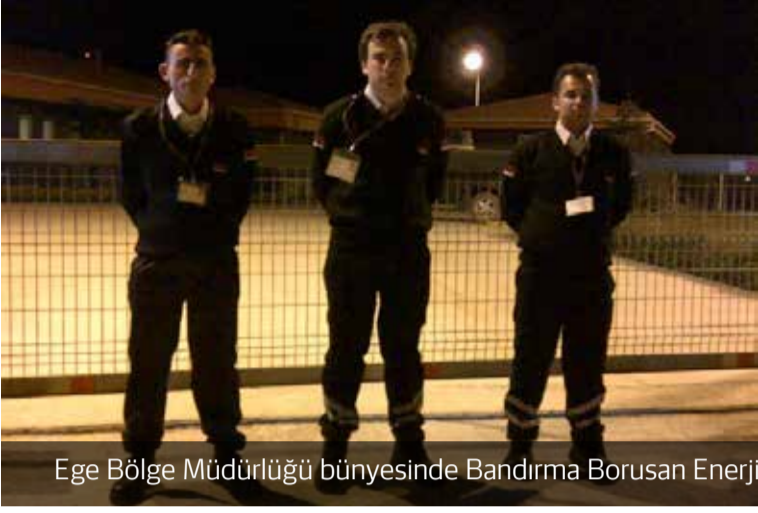
Ege Bölge Müdürlüğü bünyesinde Bandırma Borusan Enerji projesinde göreve başlandı.