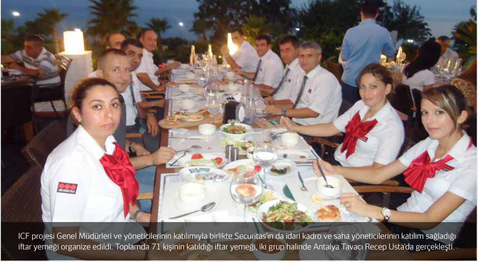
ICF projesi Genel Müdürleri ve yöneticilerinin katılımıyla birlikte Securitas'ın da idari kadro ve saha yöneticilerinin katılım sağladığı iftar yemeği organize edildi. Toplamda 71 kişinin katıldığı iftar yemeği, iki grup halinde Antalya Tavacı Recep Usta'da gerçekleşti.