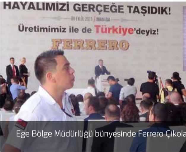
Ege Bölge Müdürlüğü bünyesinde Ferrero Çikolata Manisa projesinde göreve başlandı.