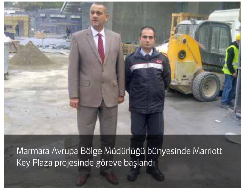
Marmara Avrupa Bölge Müdürlüğü bünyesinde Marriott Key Plaza projesinde göreve başlandı.