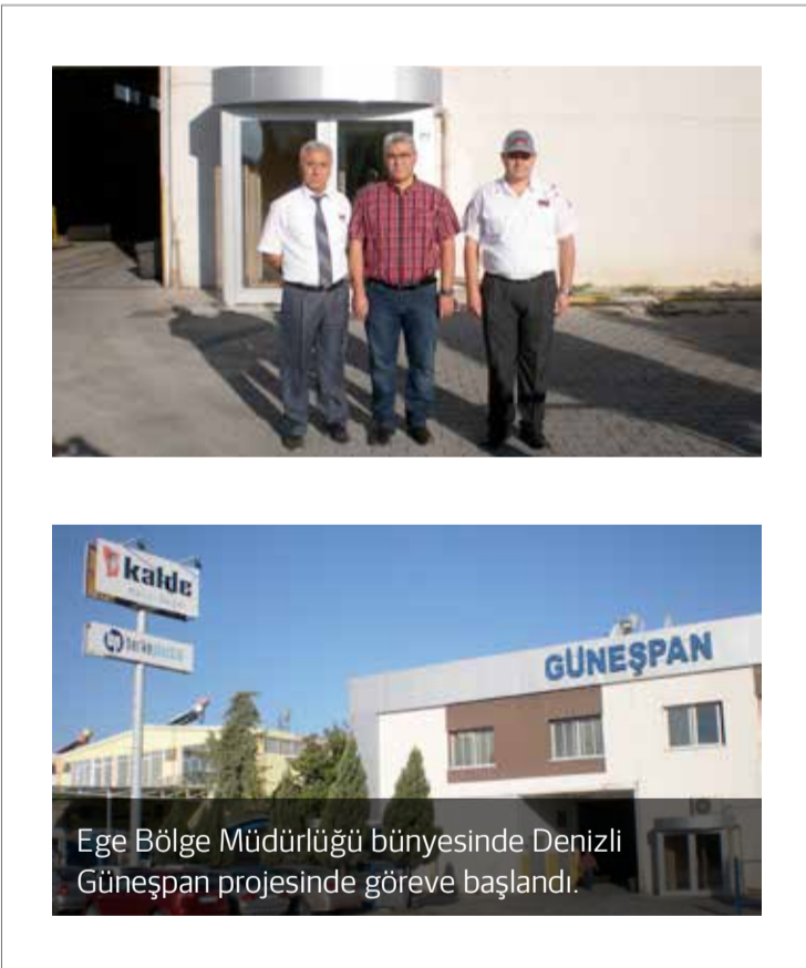
Ege Bölge Müdürlüğü bünyesinde Denizli Güneşpan projesinde göreve başlandı.