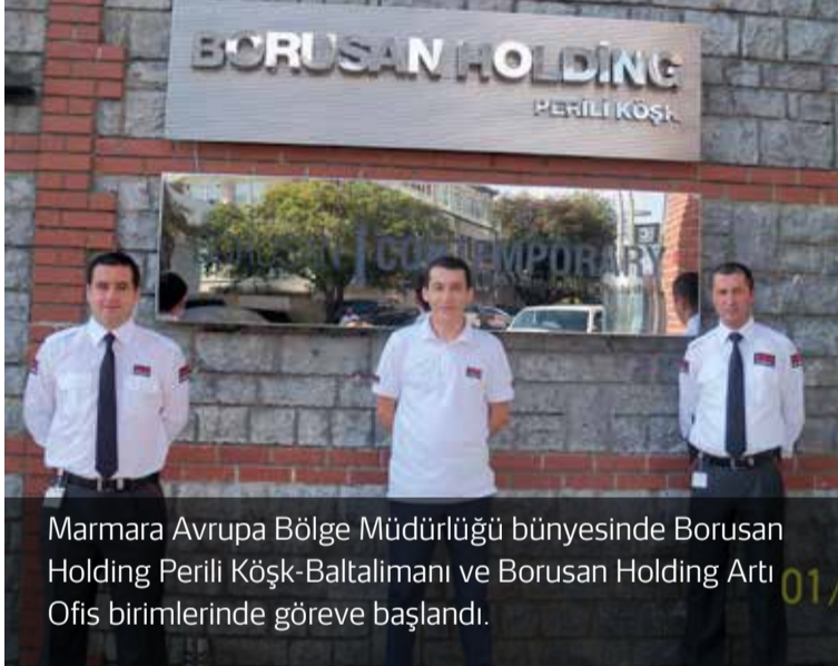
Marmara Avrupa Bölge Müdürlüğü bünyesinde Borusan Holding Perili Köşk-Baltalimanı ve Borusan Holding Artı Ofis birimlerinde göreve başlandı.