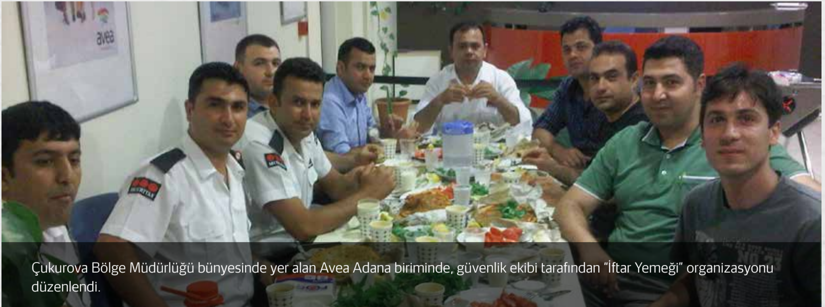
Çukurova Bölge Müdürlüğü bünyesinde yer alan Avea Adana biriminde, güvenlik ekibi tarafından "İftar Yemeği" organizasyonu düzenlendi.

Not : Cep telefonu ile çekilen fotoğrafların çözünürlüklerinin düşük olması nedeniyle üzülererek yer veremiyoruz.