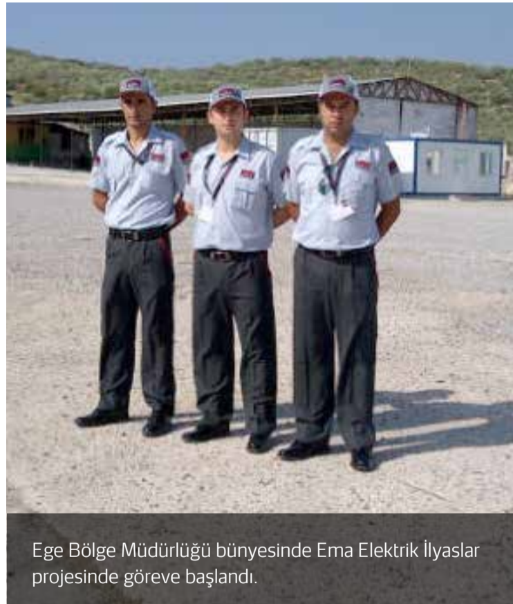
Ege Bölge Müdürlüğü bünyesinde Ema Elektrik İlyaslar projesinde göreve başlandı.