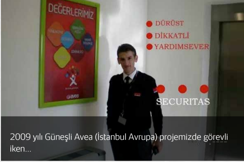
2009 yılı Güneşli Avea (İstanbul Avrupa) projemizde görevli iken...