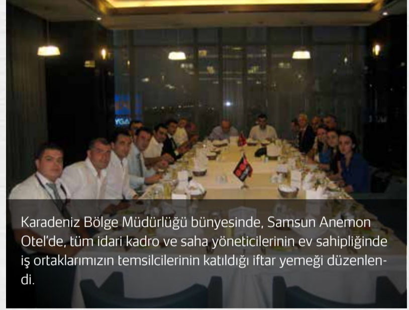
Karadeniz Bölge Müdürlüğü bünyesinde, Samsun Anemon Otel'de, tüm idari kadro ve saha yöneticilerinin ev sahipliğinde iş ortaklarımızın temsilcilerinin katıldığı iftar yemeği düzenlendi.