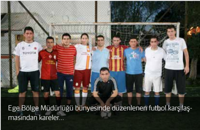
Ege Bölge Müdürlüğü bünyesinde düzenlenen futbol karşılaşmasından kareler...