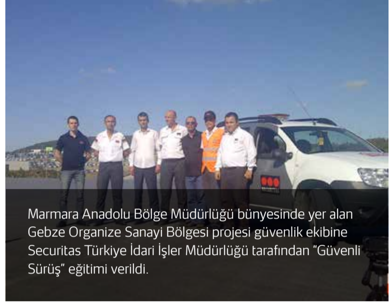
Marmara Anadolu Bölge Müdürlüğü bünyesinde yer alan Gebze Organize Sanayi Bölgesi projesi güvenlik ekibine Securitas Türkiye İdari İşler Müdürlüğü tarafından "Güvenli Sürüş" eğitimi verildi.