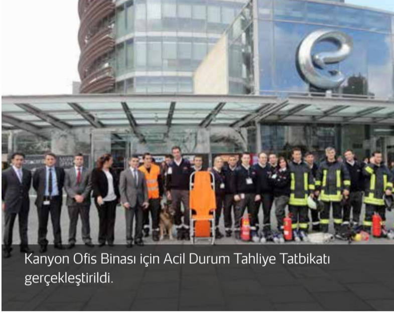
Kanyon Ofis Binası için Acil Durum Tahliye Tatbikatı gerçekleştirildi.

Hizmet verdiğimiz 76 ilde, yaklaşık 600 projede Güvenlik Görevlilerimize sunulan eğitimler hızla devam ediyor.