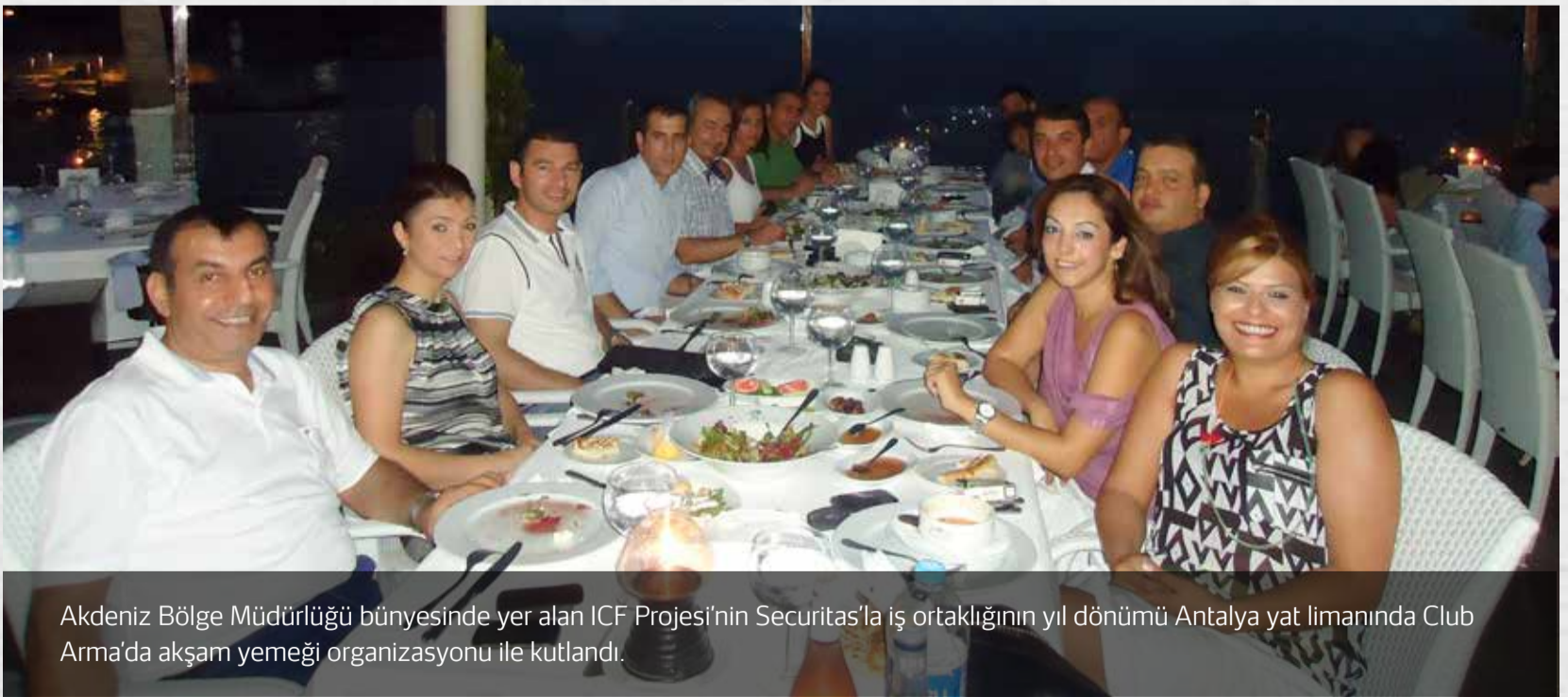
Akdeniz Bölge Müdürlüğü bünyesinde yer alan ICF Projesi'nin Securitas'la iş ortaklığının yıl dönümü Antalya yat limanında Club Arma'da akşam yemeği organizasyonu ile kutlandı.