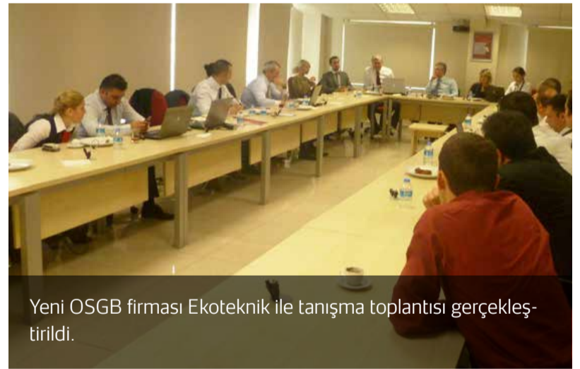
Yeni OSGB firması Ekoteknik ile tanışma toplantısı gerçekleştirildi.