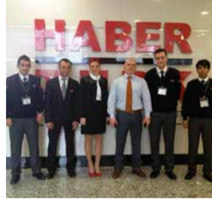
Ciner Yayın Holding Ankara HaberTürk Binası ve Ankara Matbaa birimlerinde göreve başlandı.