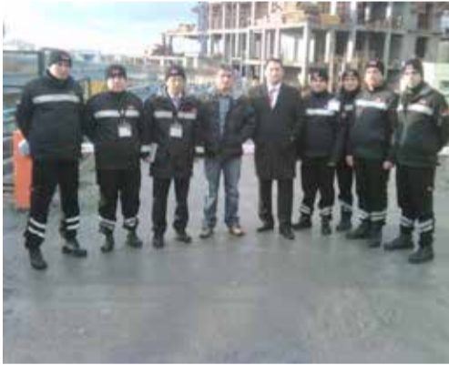
Apeas Mühendislik Hyatt Ataköy Otel şantiyesinde göreve başlandı.