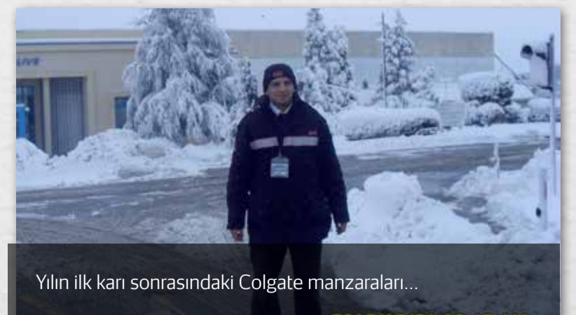
Yılın ilk karı sonrasındaki Colgate manzaraları...