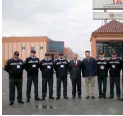
Denizli Şube Müdürlüğü bünyesinde Tan Tekstil projesine başlandı.