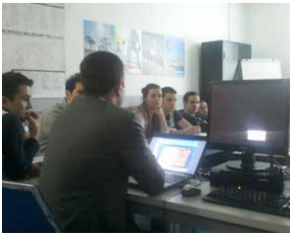
Ankara Kentpark Decathlon mağazasında, mağaza kayıpları eğitimi mağaza operasyon müdürü ve departman müdürlerinin katılımı ile gerçekleştirildi.