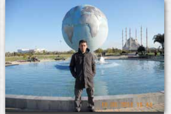
Adana Merkez Park ve Merkez Camii Göksal Bozğüney