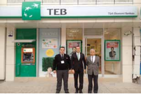
Denizli Şube Müdürlüğü bünyesinde Çivril TEB Şubesi'nde görev başı eğitimi verilerek göreve başlandı.

Securitas Türkiye, yine birçok farklı sektörde hizmet vermeye devam ediyor. Yeni projelerimizde göreve başlayan tüm çalışanlarımıza Securitas Ailesi'ne "Hoş Geldiniz" diyor ve başarılar diliyoruz.