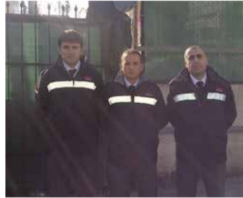
Eren Kağıt Bayrampaşa ve Topkapı kağıt toplama tesislerinde göreve başlandı.