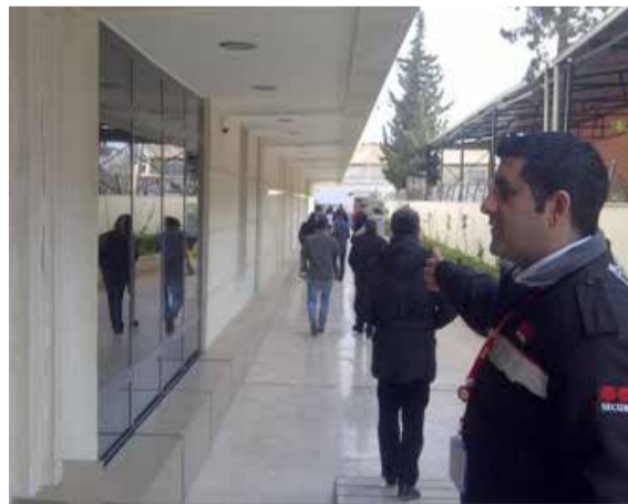
Avea Işıkkent projemizde dış kaynaklı yangın eğitimi verilerek tatbikat gerçekleştirildi.