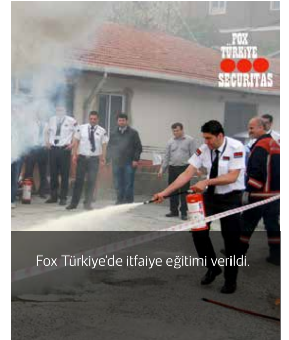
Fox Türkiye'de itfaiye eğitimi verildi.