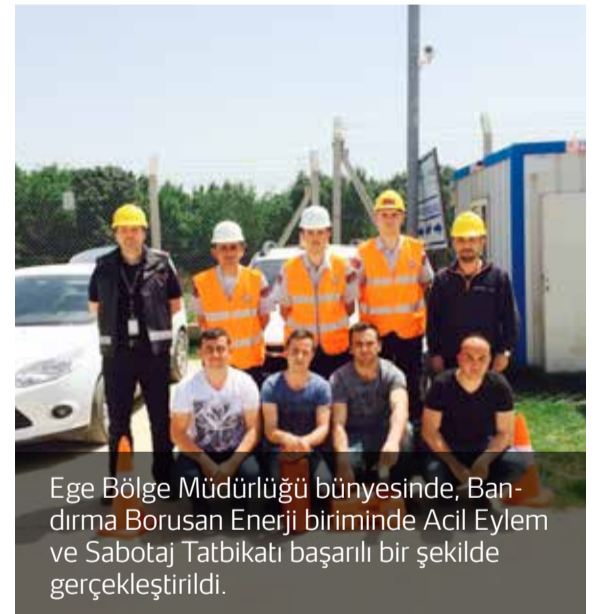
Ege Bölge Müdürlüğü bünyesinde, Bandırma Borusan Enerji biriminde Acil Eylem ve Sabotaj Tatbikatı başarılı bir şekilde gerçekleştirildi.