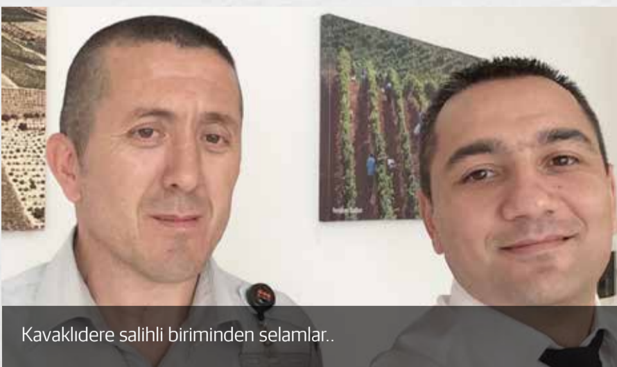
Kavaklıdere salihli biriminden selamlar..