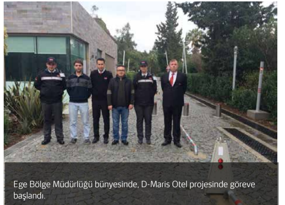
Ege Bölge Müdürlüğü bünyesinde, D-Maris Otel projesinde göreve başlandı.