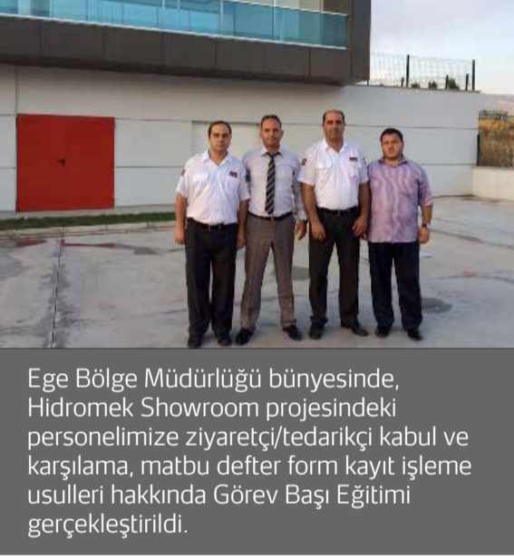
Ege Bölge Müdürlüğü bünyesinde, Hidromek Showroom projesindeki personelimize ziyaretçi/tedarikçi kabul ve karşılama, matbu defter form kayıt işleme usulleri hakkında Görev Başı Eğitimi gerçekleştirildi.