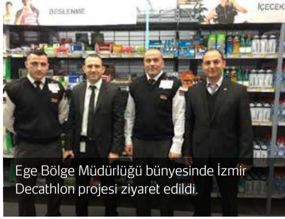
Ege Bölge Müdürlüğü bünyesinde İzmir Decathlon projesi ziyaret edildi.