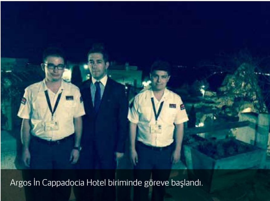
Argos İn Cappadocia Hotel biriminde göreve başlandı.