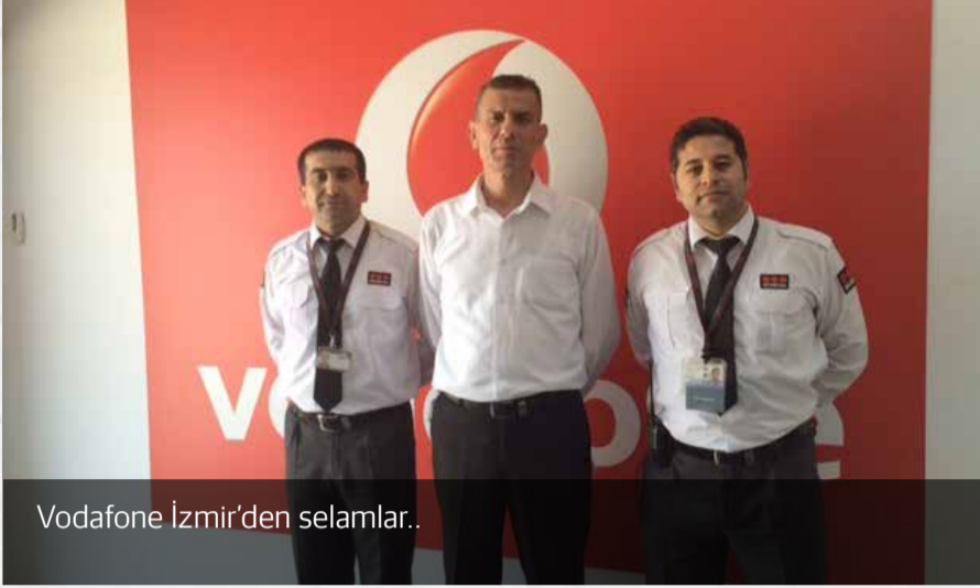
Vodafone İzmir'den selamlar..