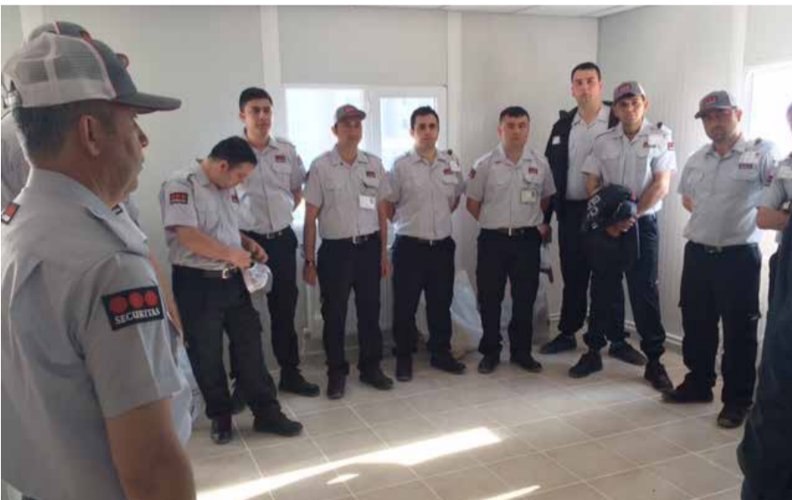
Ege Bölge Müdürlüğü bünyesinde, Doğu Holding A.Ş. Soma Konut İnşaatı Şantiyesi projesinde göreve başlandı.