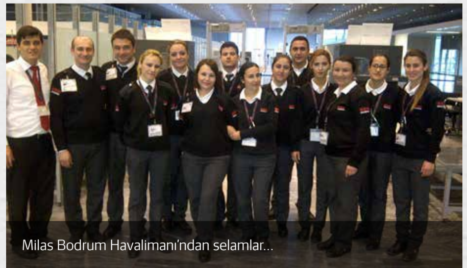
Milas Bodrum Havalimanı'ndan selamlar...

Not : Cep telefonu ile çekilen fotoğrafların çözünürlüklerinin düşük olması nedeniyle üzülerek yer veremiyoruz. 8/16 Haber'e göstermiş olduğunuz ilgi için teşekkür ederiz. Bu sayıda yer veremediğimiz fotoğrafları gelecek sayıda bulabilirsiniz.