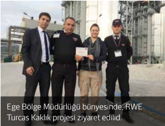
Ege Bölge Müdürlüğü bünyesinde, RWE Turcas Kaklık projesi ziyaret edilid.