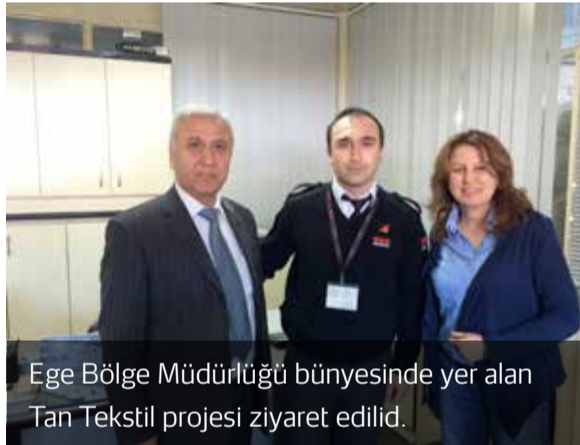
Ege Bölge Müdürlüğü bünyesinde yer alan Tan Tekstil projesi ziyaret edilid.