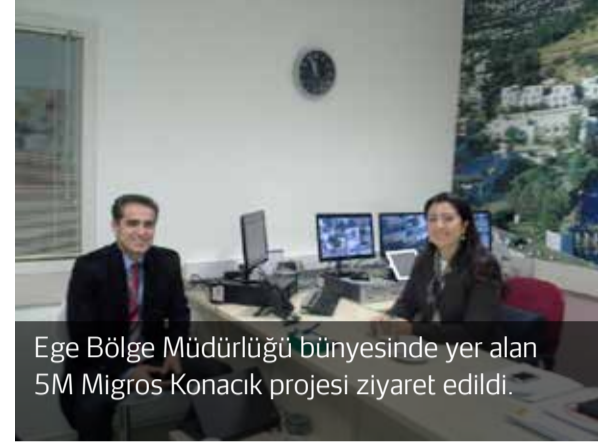
Ege Bölge Müdürlüğü bünyesinde yer alan 5M Migros Konacık projesi ziyaret edildi.