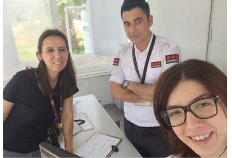
Bursa Nestle Karacabey Tesisleri