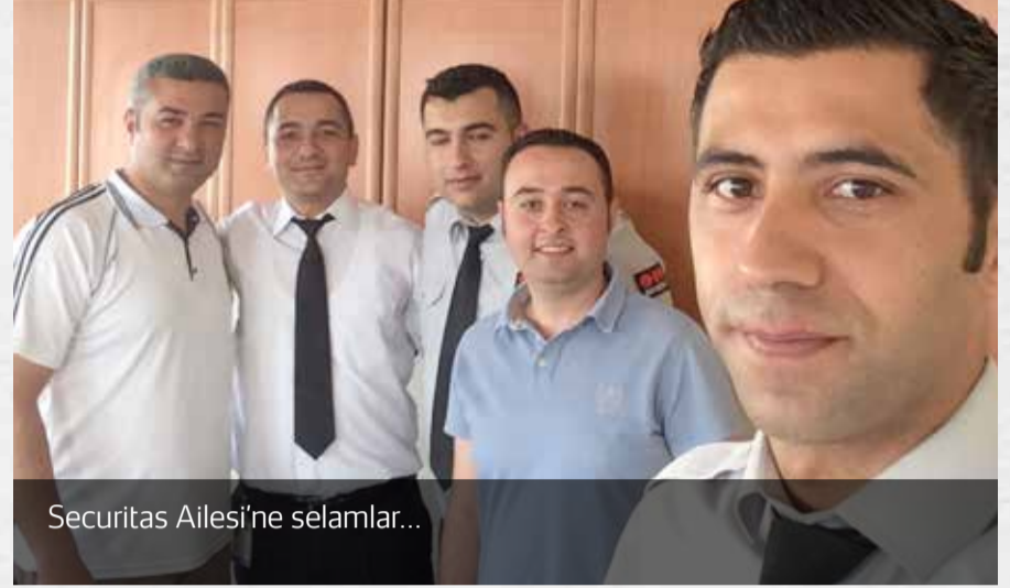
Securitas Ailesi'ne selamlar...