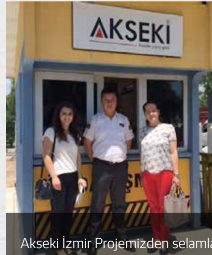
Akseki İzmir Projemizden selamlar.