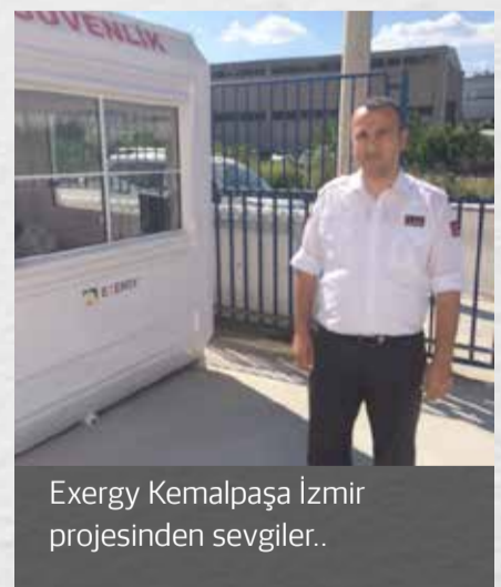
Exergy Kemalpaşa İzmir projesinden sevgiler..