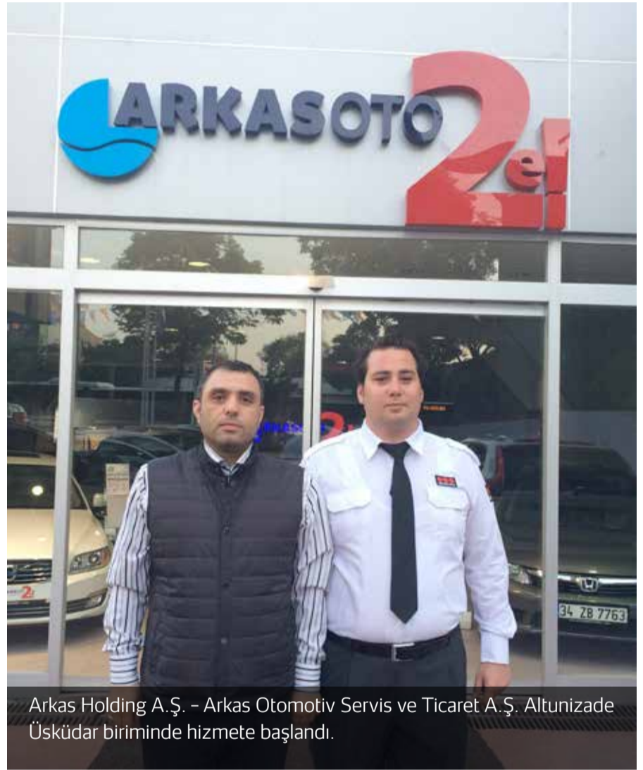
Arkas Holding A.Ş. - Arkas Otomotiv Servis ve Ticaret A.Ş. Altunizade Üsküdar biriminde hizmete başlandı.