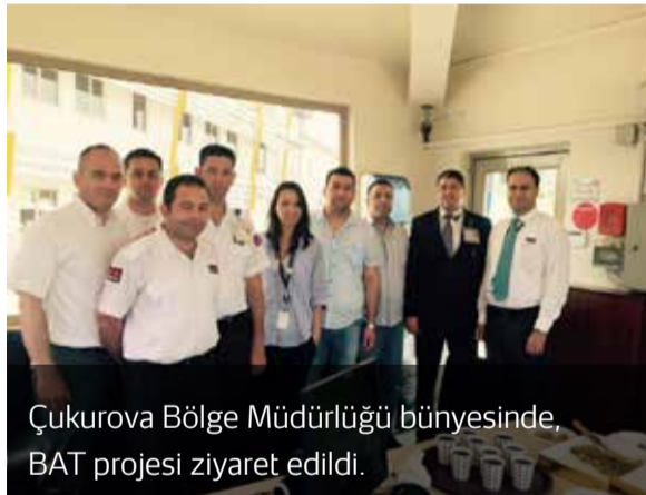
Çukurova Bölge Müdürlüğü bünyesinde, BAT projesi ziyaret edildi.