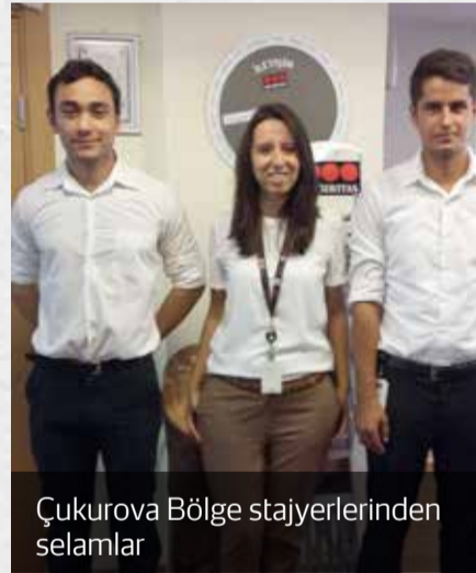
Çukurova Bölge stajyerlerinden selamlar