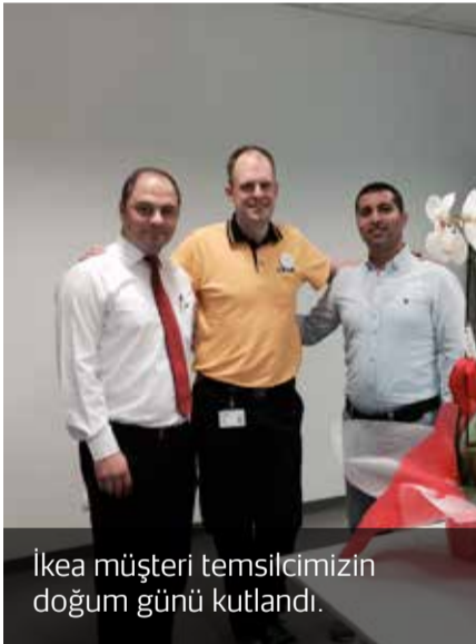
İkea müşteri temsilcimizin doğum günü kutlandı.