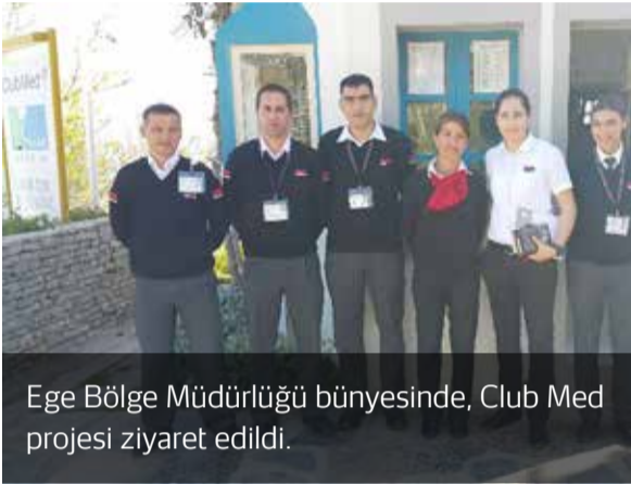
Ege Bölge Müdürlüğü bünyesinde, Club Med projesi ziyaret edildi.