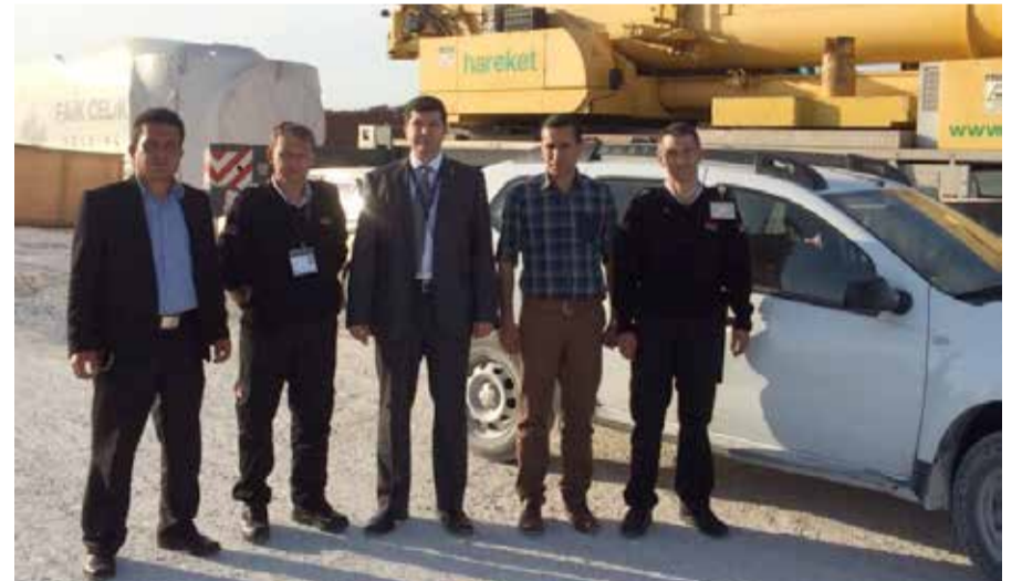
Ege Bölge Müdürlüğü bünyesinde, Gamesa Ada RES İzmir Selçuk projesinde göreve başlandı.