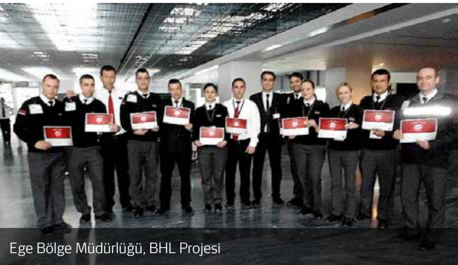
Ege Bölge Müdürlüğü, BHL Projesi