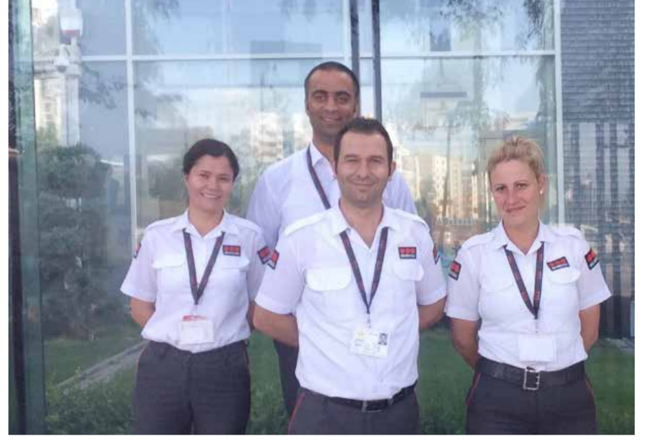
Vadi 3000 Sitesi