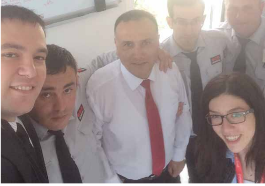
Bursa Coca Cola Kestel Fabrikası