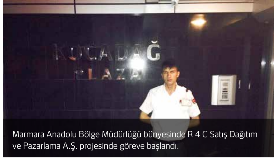
Marmara Anadolu Bölge Müdürlüğü bünyesinde R 4 C Satış Dağıtım ve Pazarlama A.Ş. projesinde göreve başlandı.