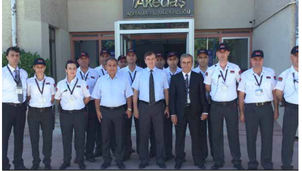
Çukurova Bölge Müdürlüğü bünyesinde Akedaş projesinde hizmete başlandı.