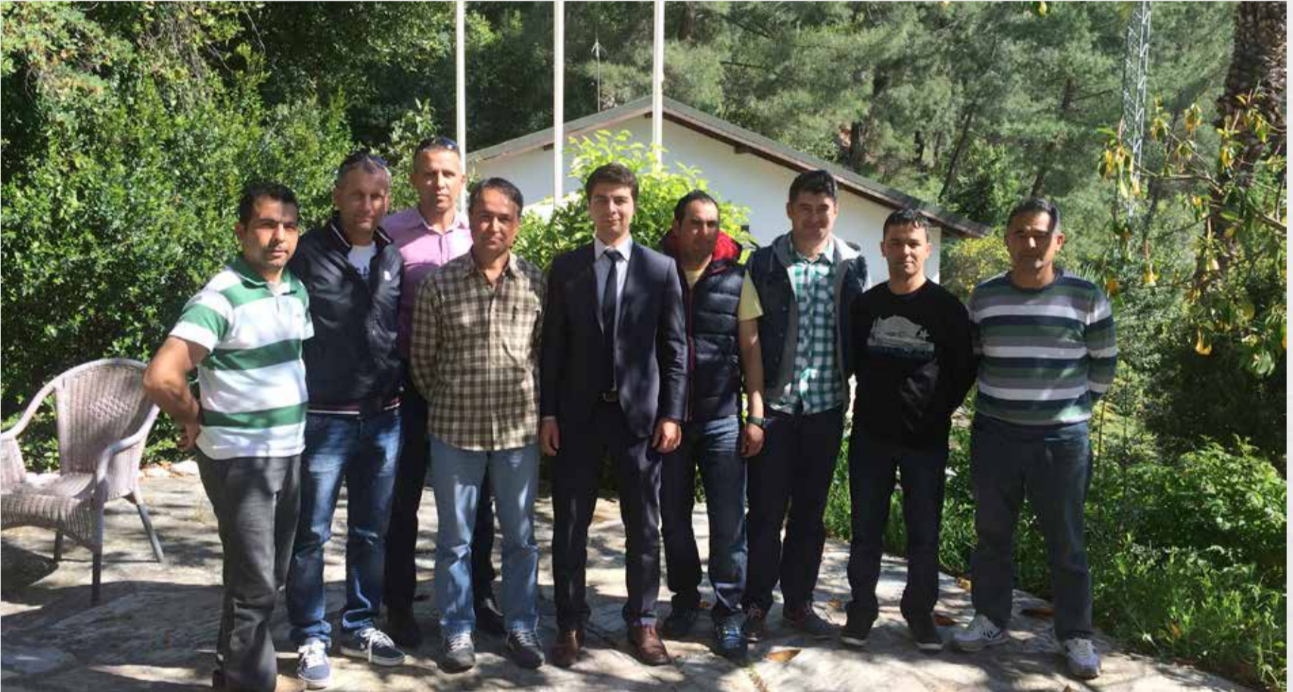
Bir arada olmanın mutluluğu ile Ege Bölge Müdürlüğü'nde yer alan D Göcek Marina projemizden tüm Securitas Ailesine selamlar.

Not : Cep telefonu ile çekilen fotoğrafların çözünürlüklerinin düşük olması nedeniyle üzülerek yer veremiyoruz. 8/16 Haber'e göstermiş olduğunuz ilgi için teşekkür ederiz. Bu sayıda yer veremediğimiz fotoğrafları gelecek sayıda bulabilirsiniz.