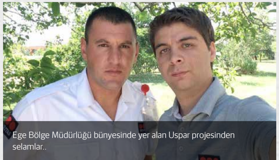
Ege Bölge Müdürlüğü bünyesinde yer alan Uspar projesinden selamlar..

Not : Cep telefonu ile çekilen fotoğrafların çözünürlüklerinin düşük olması nedeniyle üzülerek yer veremiyoruz. 8/16 Haber'e göstermiş olduğunuz ilgi için teşekkür ederiz. Bu sayıda yer veremediğimiz fotoğrafları gelecek sayıda bulabilirsiniz.