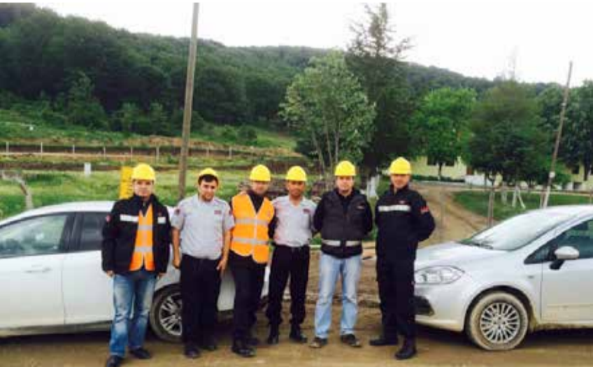
Ege Bölge Müdürlüğü bünyesinde, Enercon Servis Ltd. Şti. Manisa Gelenbe Kuyucak biriminde göreve başlandı.