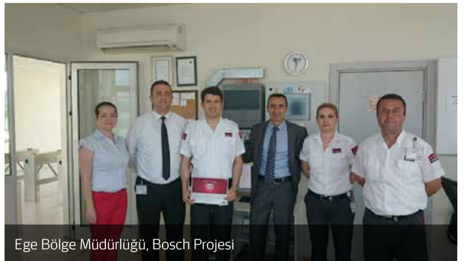
Ege Bölge Müdürlüğü, Bosch Projesi