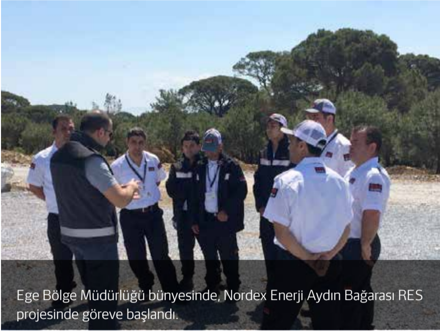
Ege Bölge Müdürlüğü bünyesinde, Nordex Enerji Aydın Bağarası RES projesinde göreve başlandı.