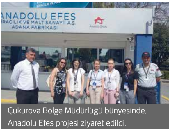
Çukurova Bölge Müdürlüğü bünyesinde, Anadolu Efes projesi ziyaret edildi.