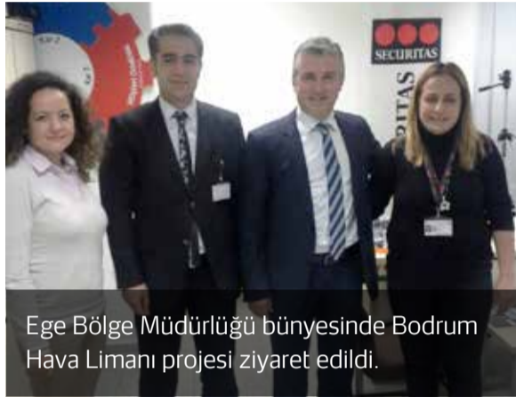
Ege Bölge Müdürlüğü bünyesinde Bodrum Hava Limanı projesi ziyaret edildi.