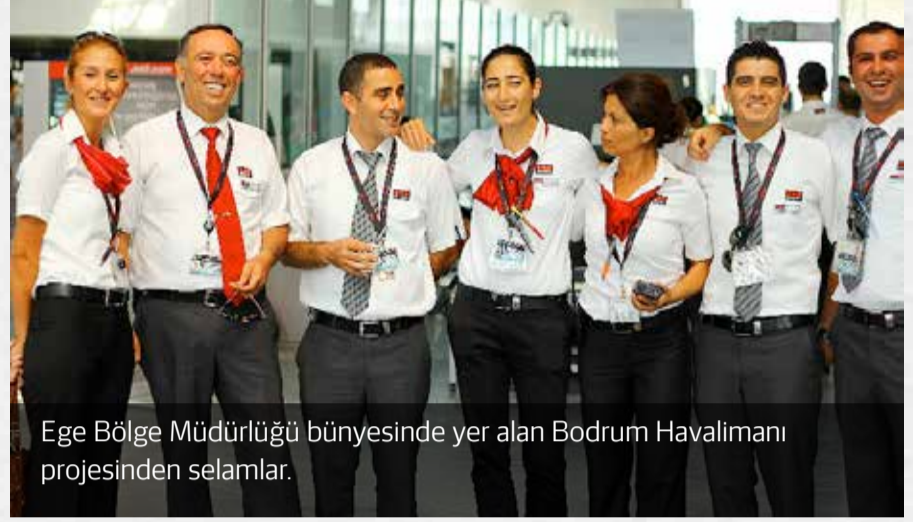
Ege Bölge Müdürlüğü bünyesinde yer alan Bodrum Havalimanı projesinden selamlar.