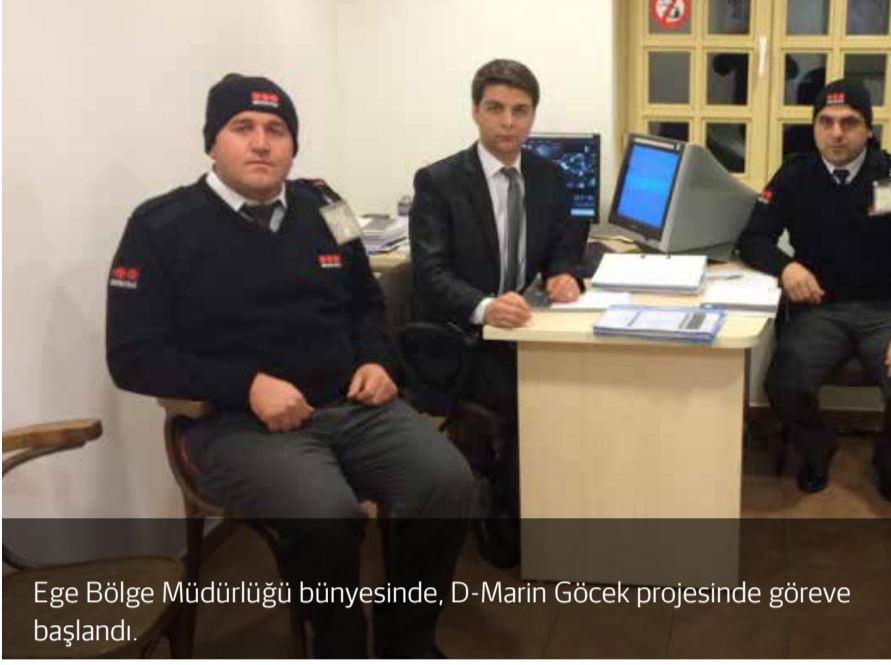
Ege Bölge Müdürlüğü bünyesinde, D-Marin Göcek projesinde göreve başlandı.

Securitas Türkiye, yine birçok farklı sektörde hizmet vermeye devam ediyor. Yeni projelerimizde göreve başlayan tüm çalışanlarımıza Securitas Ailesi'ne "Hoş Geldiniz" diyor ve başarılar diliyoruz.