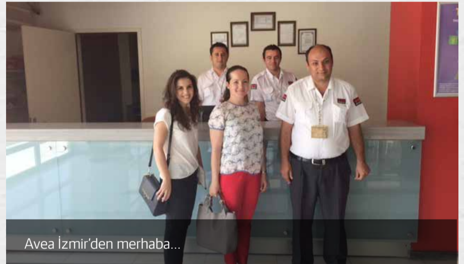
Avea İzmir'den merhaba...