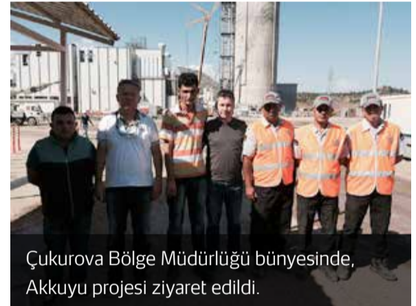
Çukurova Bölge Müdürlüğü bünyesinde, Akkuyu projesi ziyaret edildi.