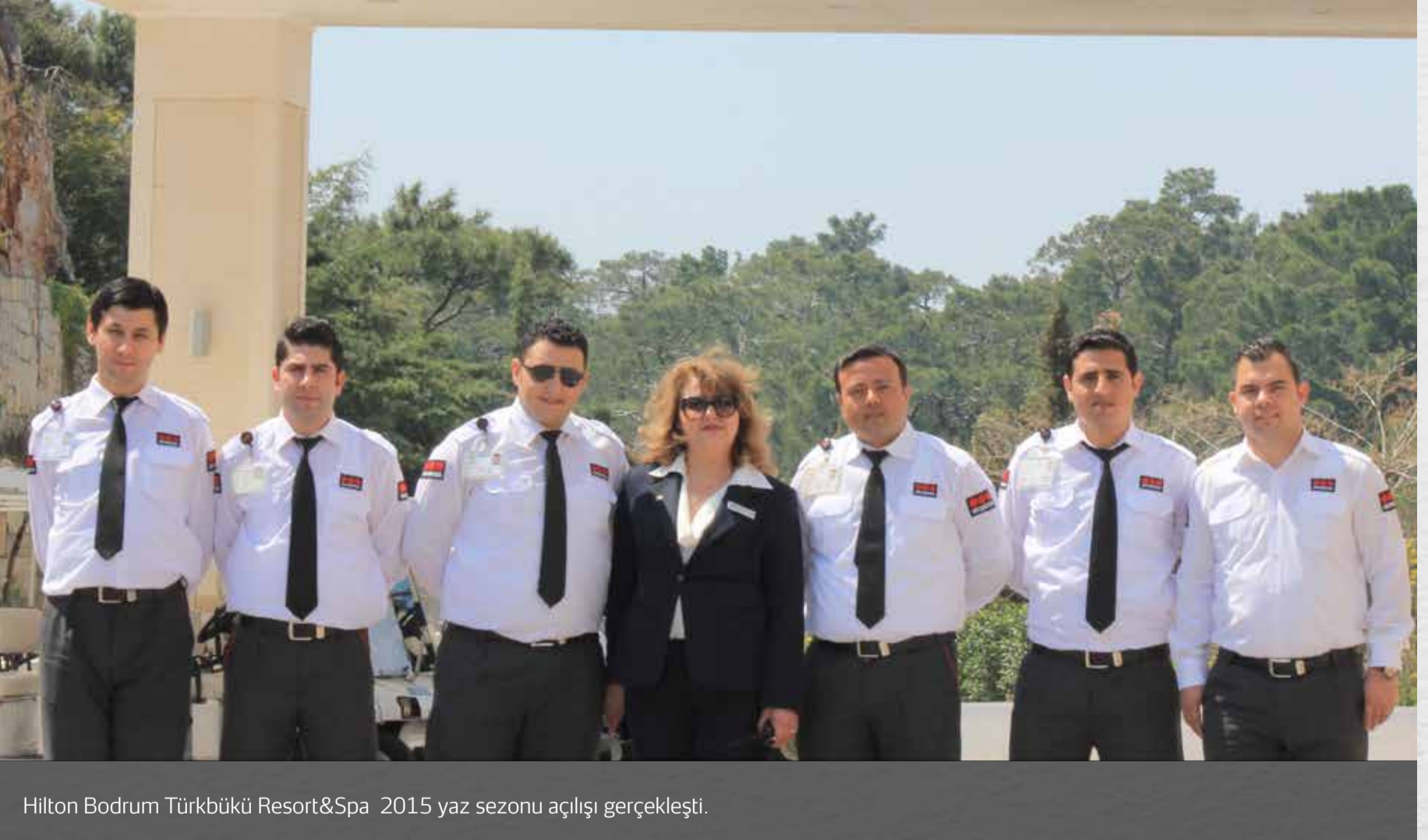
Hilton Bodrum Türkbükü Resort&Spa 2015 yaz sezonu açılışı gerçekleşti.