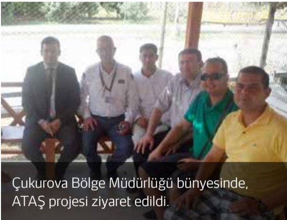
Çukurova Bölge Müdürlüğü bünyesinde, ATAŞ projesi ziyaret edildi.