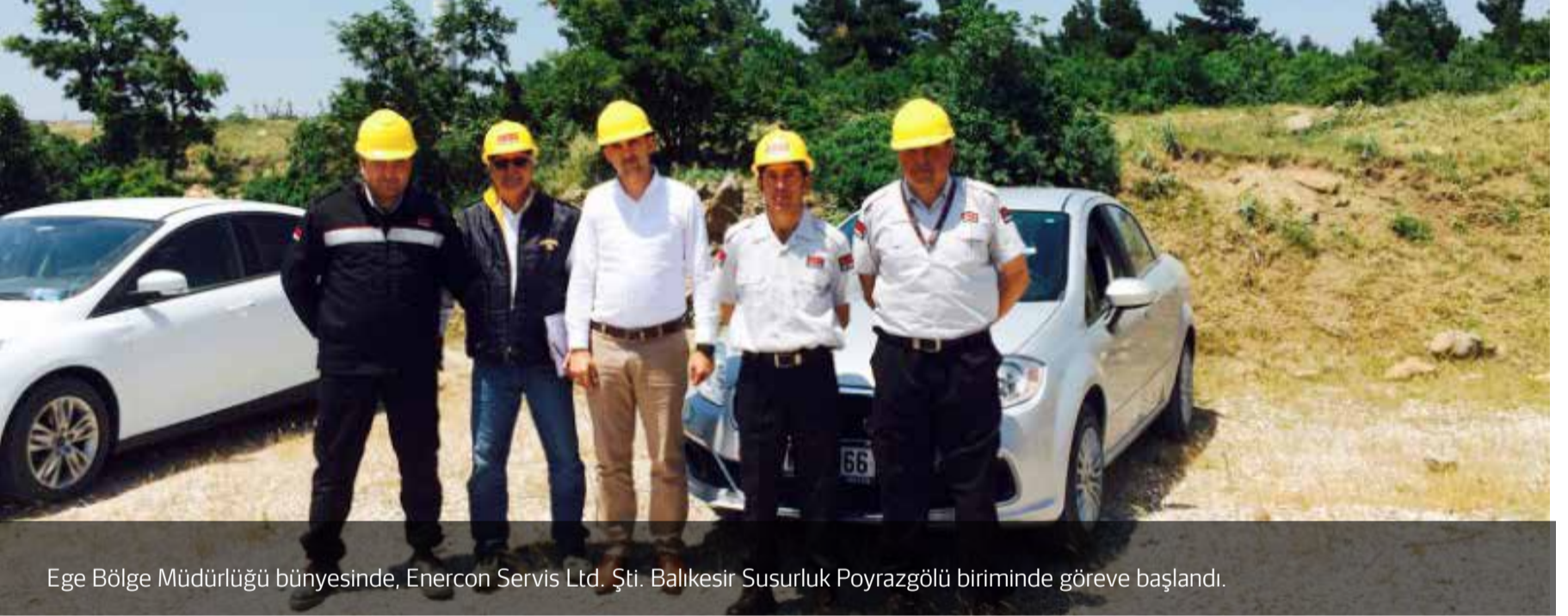
Ege Bölge Müdürlüğü bünyesinde, Enercon Servis Ltd. Şti. Balıkesir Susurluk Poyrazgölü biriminde göreve başlandı.