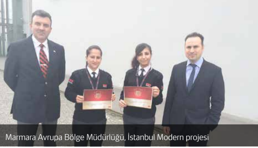
Marmara Avrupa Bölge Müdürlüğü, İstanbul Modern projesi