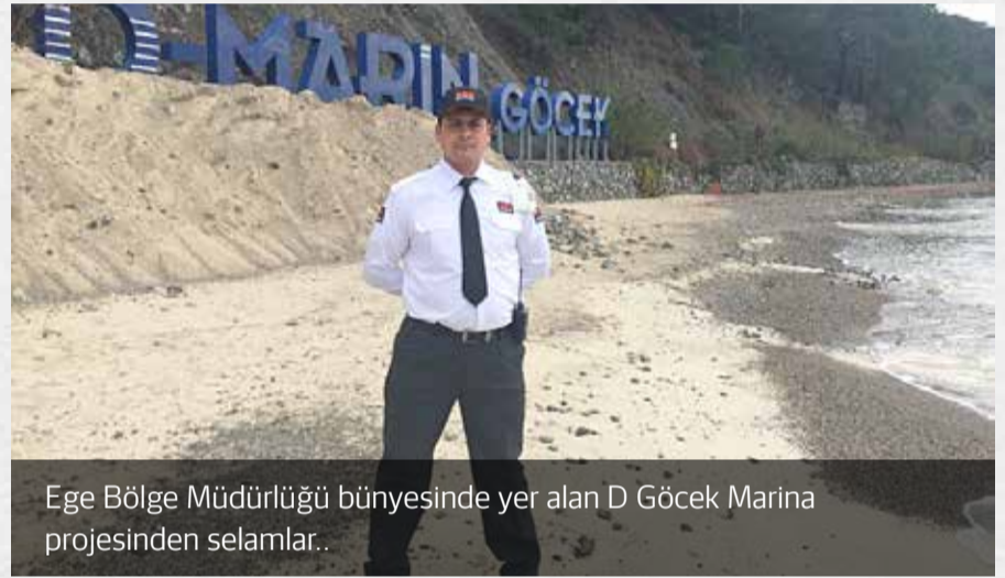
Ege Bölge Müdürlüğü bünyesinde yer alan D Göcek Marina projesinden selamlar..