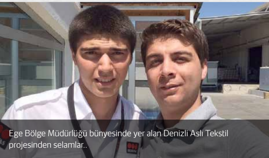
Ege Bölge Müdürlüğü bünyesinde yer alan Denizli Aslı Tekstil projesinden selamlar..