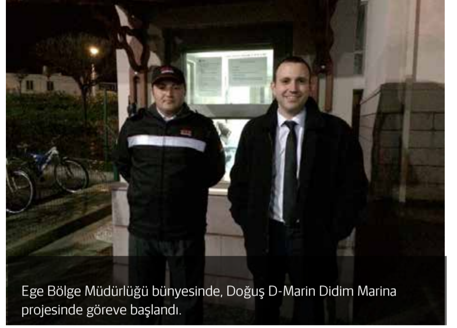
Ege Bölge Müdürlüğü bünyesinde, Doğu D-Marin Didim Marina projesinde göreve başlandı.