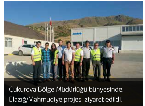
Çukurova Bölge Müdürlüğü bünyesinde, Elazığ/Mahmudiye projesi ziyaret edildi.