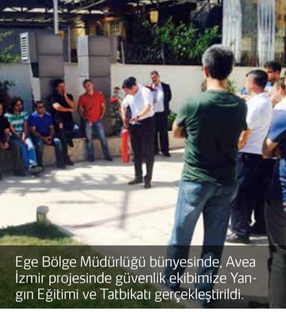
Ege Bölge Müdürlüğü bünyesinde, Avea İzmir projesinde güvenlik ekibimize Yangın Eğitimi ve Tatbikatı gerçekleştirildi.

Hizmet verdiğimiz 76 ilde, yaklaşık 600 projede güvenlik görevlilerimize sunulan eğitimler hızla devam ediyor.