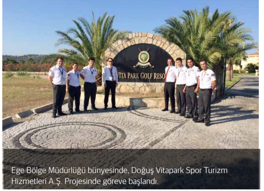
Ege Bölge Müdürlüğü bünyesinde, Doğu Vitapark Spor Turizm Hizmetleri A.Ş. Projesinde göreve başlandı.