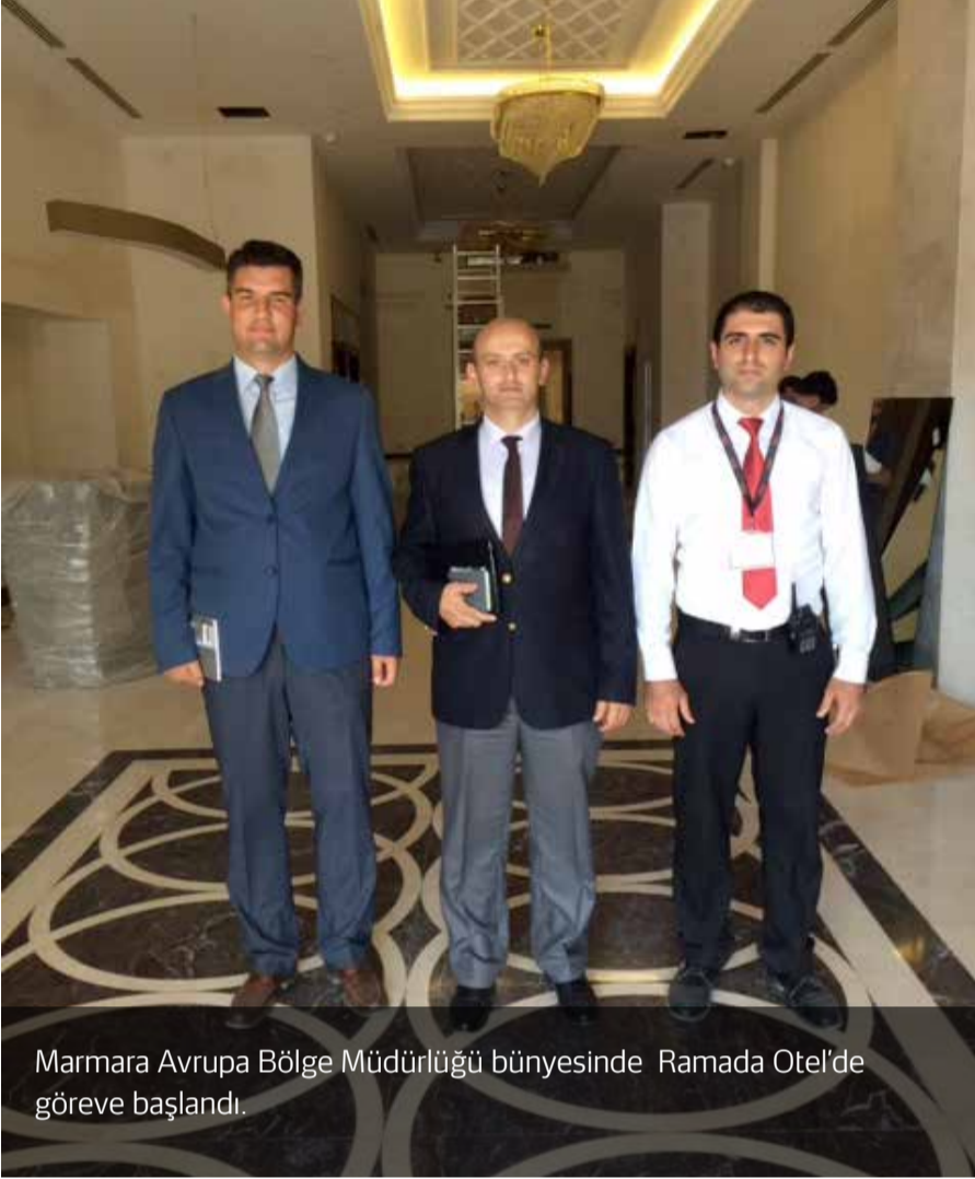
Marmara Avrupa Bölge Müdürlüğü bünyesinde Ramada Otel'de göreve başlandı.