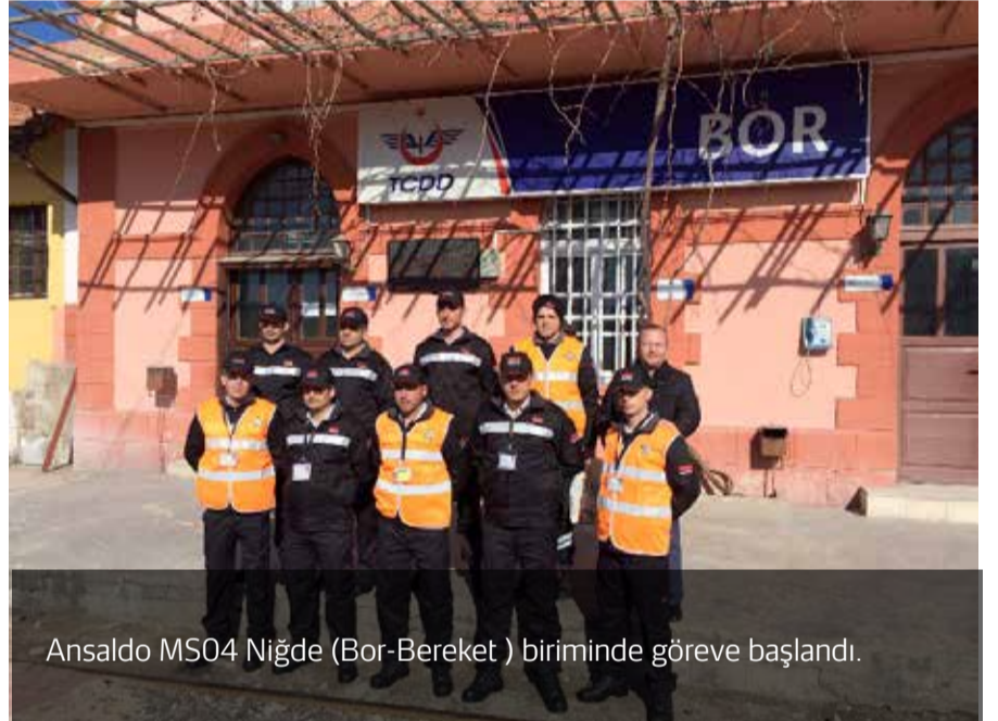
Ansaldo MS04 Niğde (Bor-Bereket ) biriminde göreve başlandı.