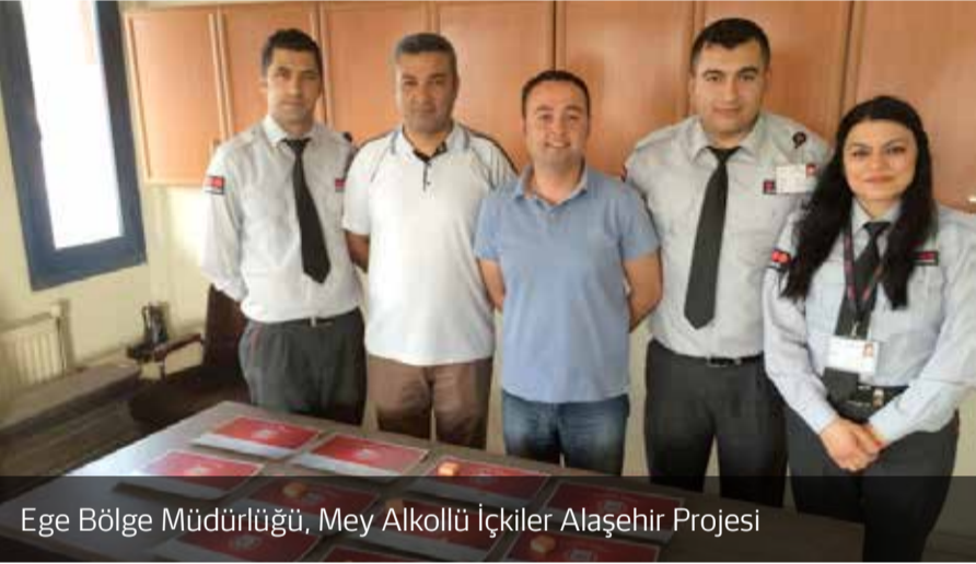
Ege Bölge Müdürlüğü, Mey Alkollü İçkiler Alaşehir Projesi