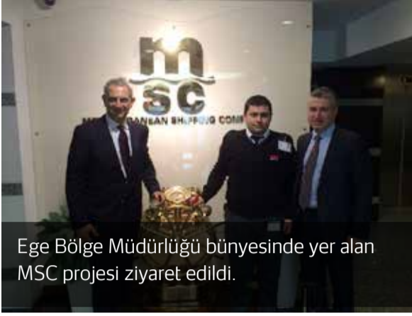
Ege Bölge Müdürlüğü bünyesinde yer alan MSC projesi ziyaret edildi.