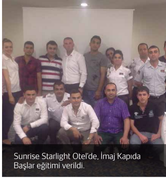
Sunrise Starlight Otel'de, İmaj Kapıda Başlar eğitimi verildi.