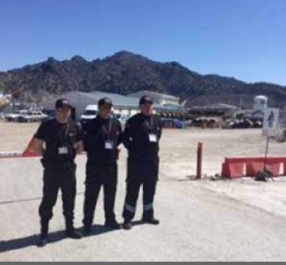
Karadeniz Bölge Müdürlüğü bünyesinde Gülermak Ağır Sanayi Taahhüt A.Ş. Osmancık ve Maksutlu şantiyede göreve başlandı.

Securitas Türkiye, yine birçok farklı sektörde hizmet vermeye devam ediyor. Yeni projelerimizde göreve başlayan tüm çalışanlarımıza Securitas Ailesi'ne "Hoş Geldiniz" diyor ve başarılar diliyoruz.