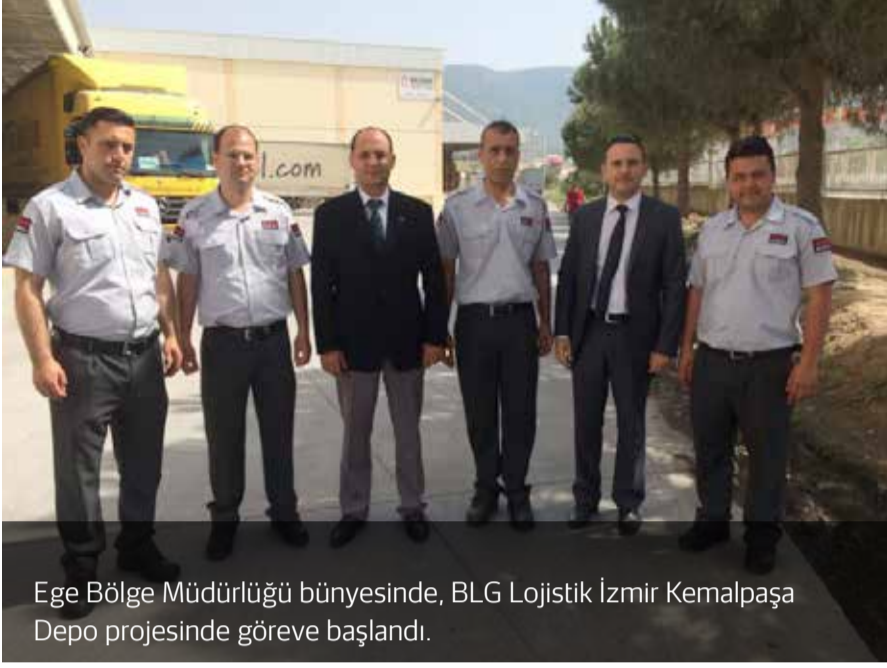
Ege Bölge Müdürlüğü bünyesinde, BLG Lojistik İzmir Kemalpaşa Depo projesinde göreve başlandı.