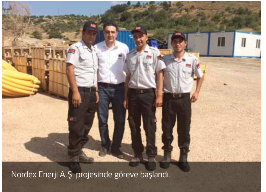
Nordex Enerji A.Ş. projesinde göreve başlandı.