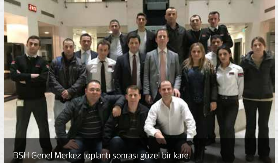
BSH Genel Merkez toplantı sonrası güzel bir kare.