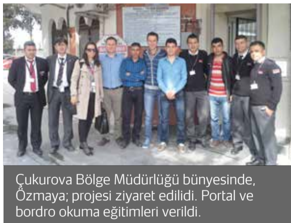
Çukurova Bölge Müdürlüğü bünyesinde, Özmaya; projesi ziyaret edildi. Portal ve bordro okuma eğitimleri verildi.