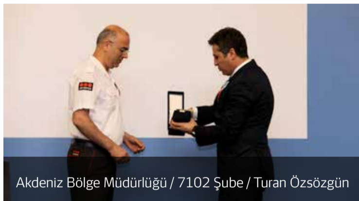
Akdeniz Bölge Müdürlüğü / 7102 Şube / Turan Özsoğün

Bu sene dördüncüsü gerçekleştirilen ödül töreninde, Ülke Başkanı Murat Kösereisöğlü, iş etiği ve göreve duyulan bağlılığa dikkat çekerek, "Bugün burada mesleğini layıkıyla yapan 11 bin kişiden oluşan Securitas Ailesi adına ödül almaya gelen 14 arkadaşımız bulunuyor. Her birimiz değerlerimize sahip çıkarak işimizi layıkıyla yaptığımız sürece birer kahramanınız. Her geçen gün bir adım daha ileriye giden güvenlik sektörü, bu sektörün temsilcileri ile değer buluyor. Securitas olarak bizlerin de birincil görevi önce kendi can güvenliğini sağlayarak hizmet sunduğumuz alanlarda insanların kendilerini daha güvende hissetmelerini sağlamak ve en iyi hizmeti sunmak" diyerek sözlerini noktaladı.