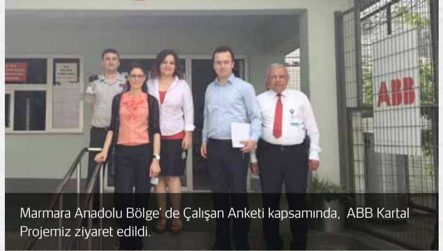
Marmara Anadolu Bölge' de Çalışan Anketi kapsamında, ABB Kartal Projemiz ziyaret edildi.