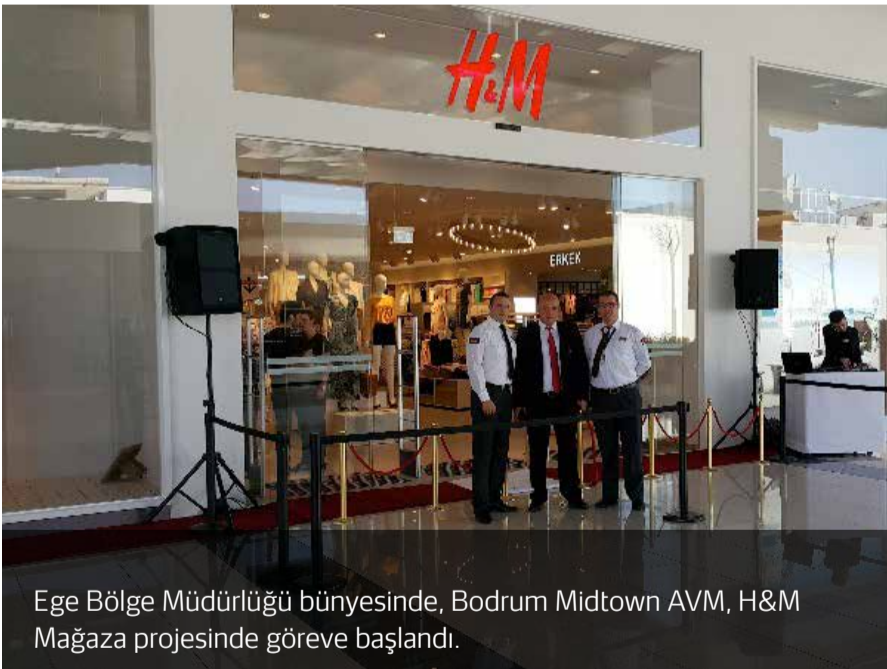
Ege Bölge Müdürlüğü bünyesinde, Bodrum Midtown AVM, H&M Mağaza projesinde göreve başlandı.