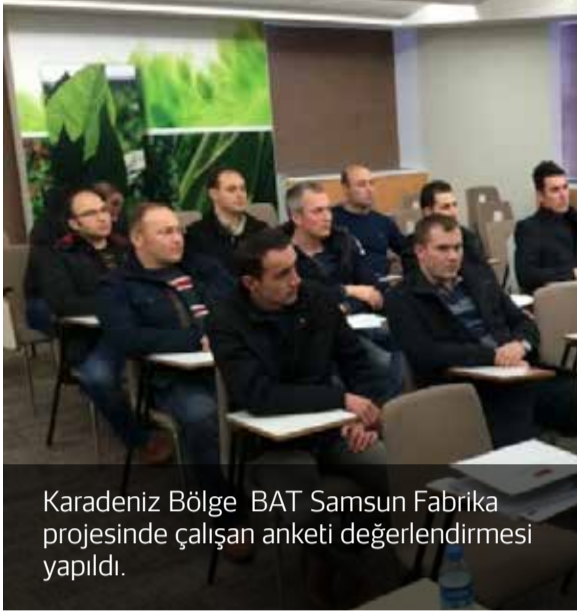
Karadeniz Bölge BAT Samsun Fabrika projesinde çalışan anketi değerlendirmesi yapıldı.

Hizmet verdiğimiz 76 ilde, yaklaşık 600 projede güvenlik görevlilerimize sunulan eğitimler hızla devam ediyor.