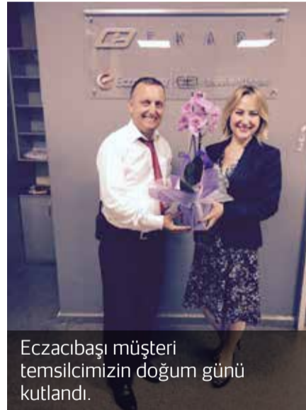
Eczacıbaşı müşteri temsilcimizin doğum günü kutlandı.