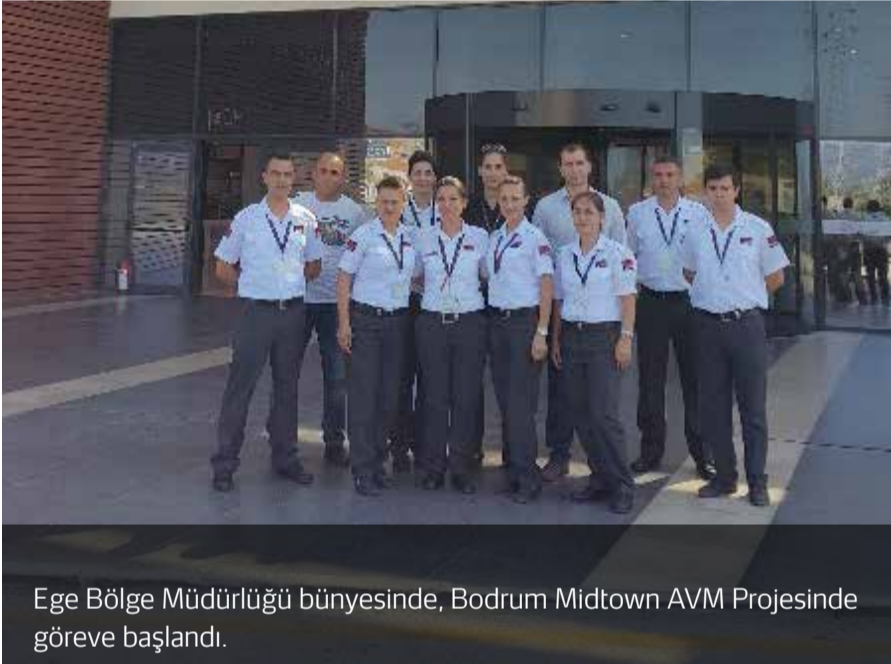
Ege Bölge Müdürlüğü bünyesinde, Bodrum Midtown AVM Projesinde göreve başlandı.