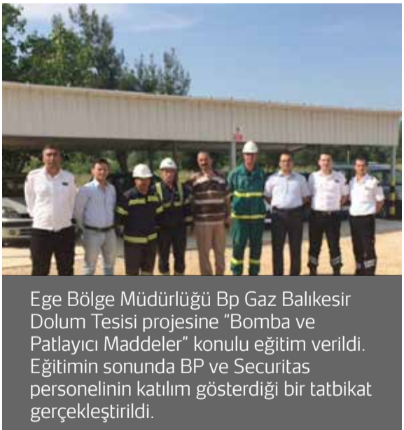
Ege Bölge Müdürlüğü Bp Gaz Balıkesir Dolum Tesisi projesine "Bomba ve Patlayıcı Maddeler" konulu eğitim verildi. Eğitimin sonunda BP ve Securitas personelinin katılım gösterdiği bir tatbikat gerçekleştirildi.