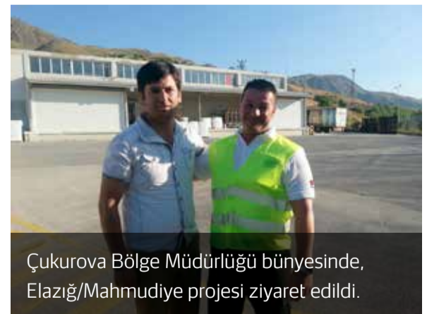
Çukurova Bölge Müdürlüğü bünyesinde, Elazığ/Mahmudiye projesi ziyaret edildi.