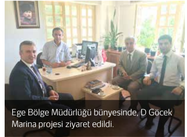
Ege Bölge Müdürlüğü bünyesinde, D Göcek Marina projesi ziyaret edildi.