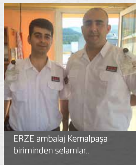
ERZE ambalaj Kemalpaşa biriminden selamlar..