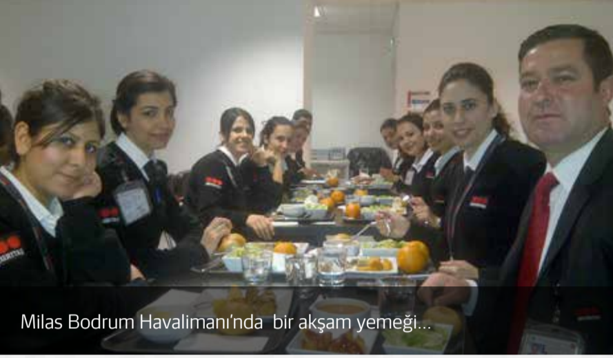
Milas Bodrum Havalimanı'nda bir akşam yemeği...