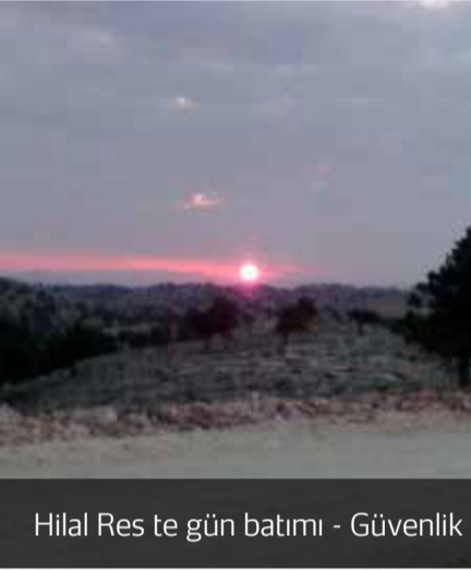
Hilal Res te gün batımı - Güvenlik görevlisi Ali Gezer'den selamlar.