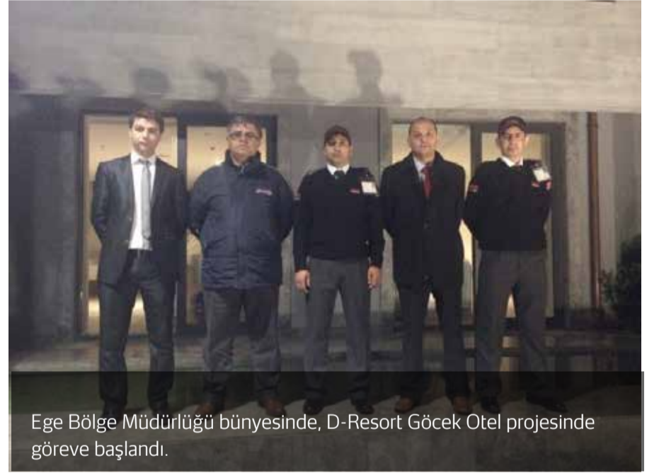
Ege Bölge Müdürlüğü bünyesinde, D-Resort Göcek Otel projesinde göreve başlandı.