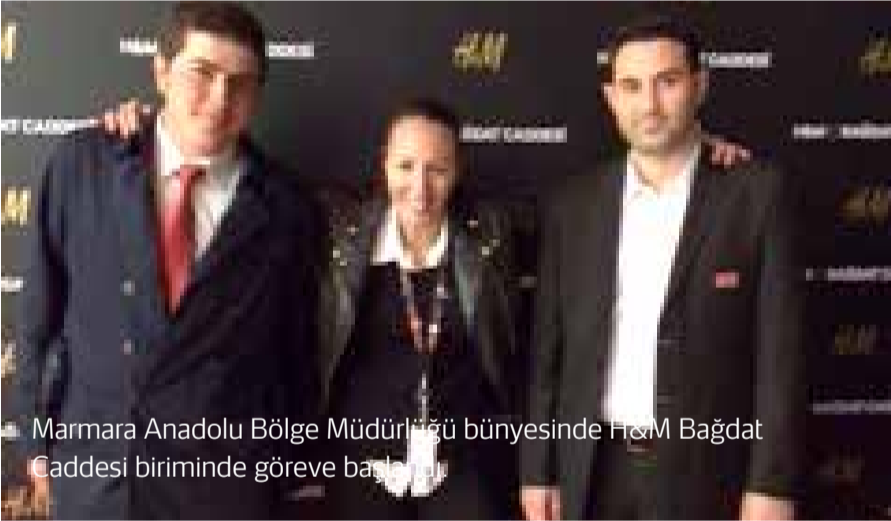
Marmara Anadolu Bölge Müdürlüğü bünyesinde H&M Bağdat Caddesi biriminde göreve başlandı.