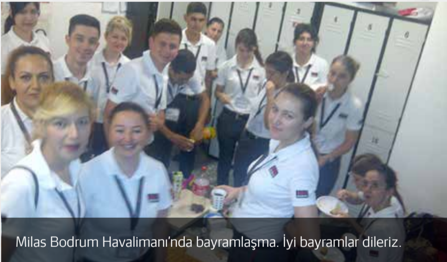
Milas Bodrum Havalimanı'nda bayramlaşma. İyi bayramlar dileriz.